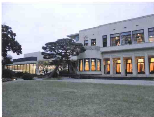
久米設計「東京都庭園美術館」夜景