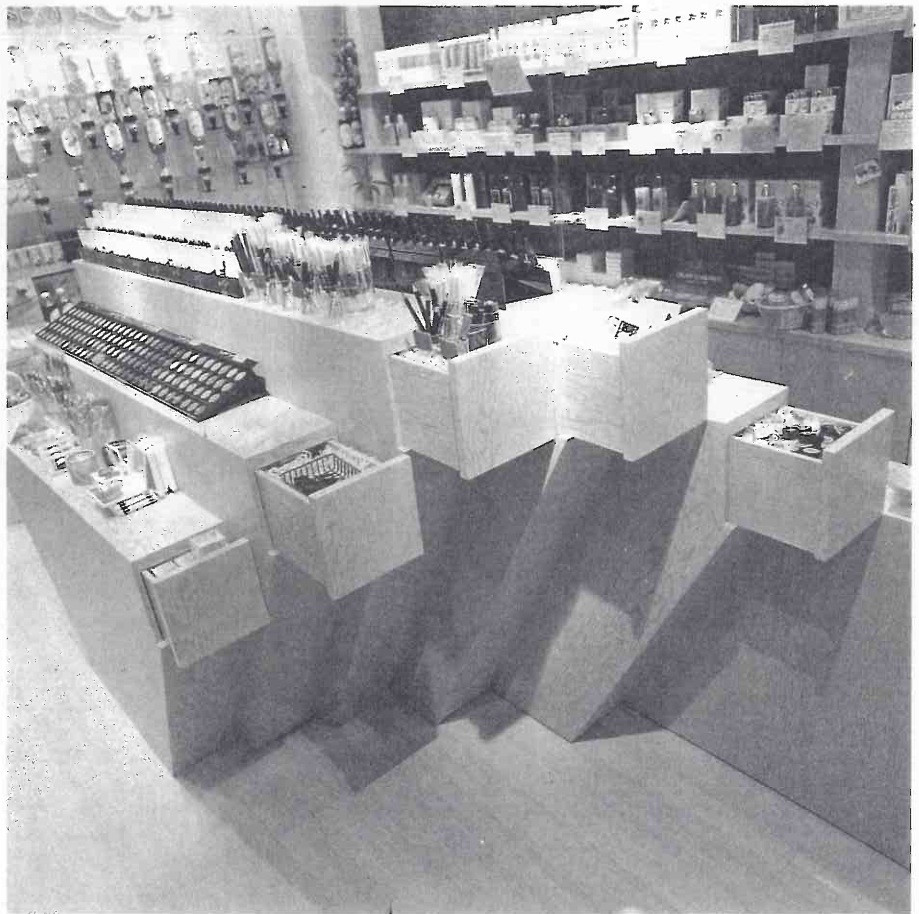
ディスプレイ什器詳細。この反対側の側面はフラットに載ち落とされているが、同様のひきだしが付いている